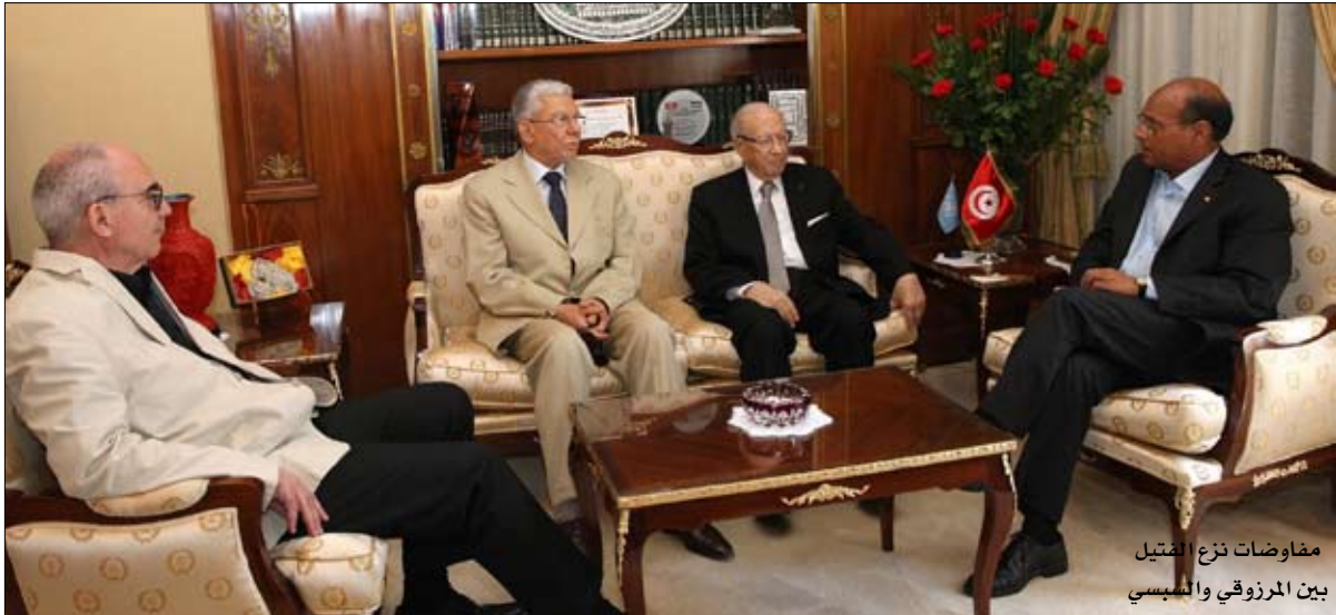
مفاوضات نزع التماسك بين المرزوقي والسبسي

موقفها من مبادرة الإنقاذ التي تم الإعلان عنها رسميا بقيادة الجبهة الشعبية والاتحاد من أجل تونس ضمينا في بيانها الصادر عن تسميتها والذي جاء فيه أن التسميية تثنى مواقف كل الأطراف السياسية الوطنية المتمسكة بالمسار الديمقراطي القائم والمجلس الوطني التأسيسي في تونس وتدعو المجموعة الوطنية إلى استخلاص الدروس من الأحداث الجارية في مصر، والابتعاد عن كل ما من شأنه تعطيل التوافق الوطني ودفع البلاد في مسار مجهول العواقب. وأكدت التسميية حرصها على الحوار الوطني التونسي الشامل وضرورة تدعيم عمل لجنة التوافقات داخل المجلس الوطني التأسيسي بما يعجل استكمال الدستور وإنهاء المرحلة الانتقالية والوصول إلى الاستحقاق الانتخابي القادم في كنف الاستقرار السياسي والأمني والاقتصادي. وفي تعليقه على دعوة أحزاب الترويكا لإعادة بناء توافقات جديدة والعودة للحوار، أوضح زياد الأخضر أمين عام حزب الوطد الموحد، أن الجبهة الشعبية وعدة قوى ديمقراطية أخرى صبرت كثيرا وسعت إلى البحث عن التوافق وشاركت في كل مؤتمرات