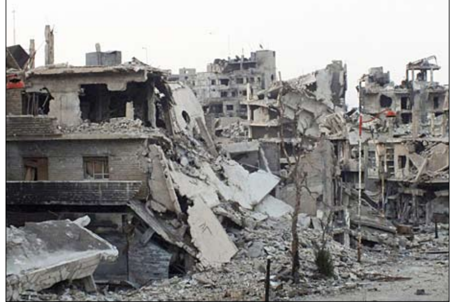
منظر عام للدمار الهائل في مدينة حمص