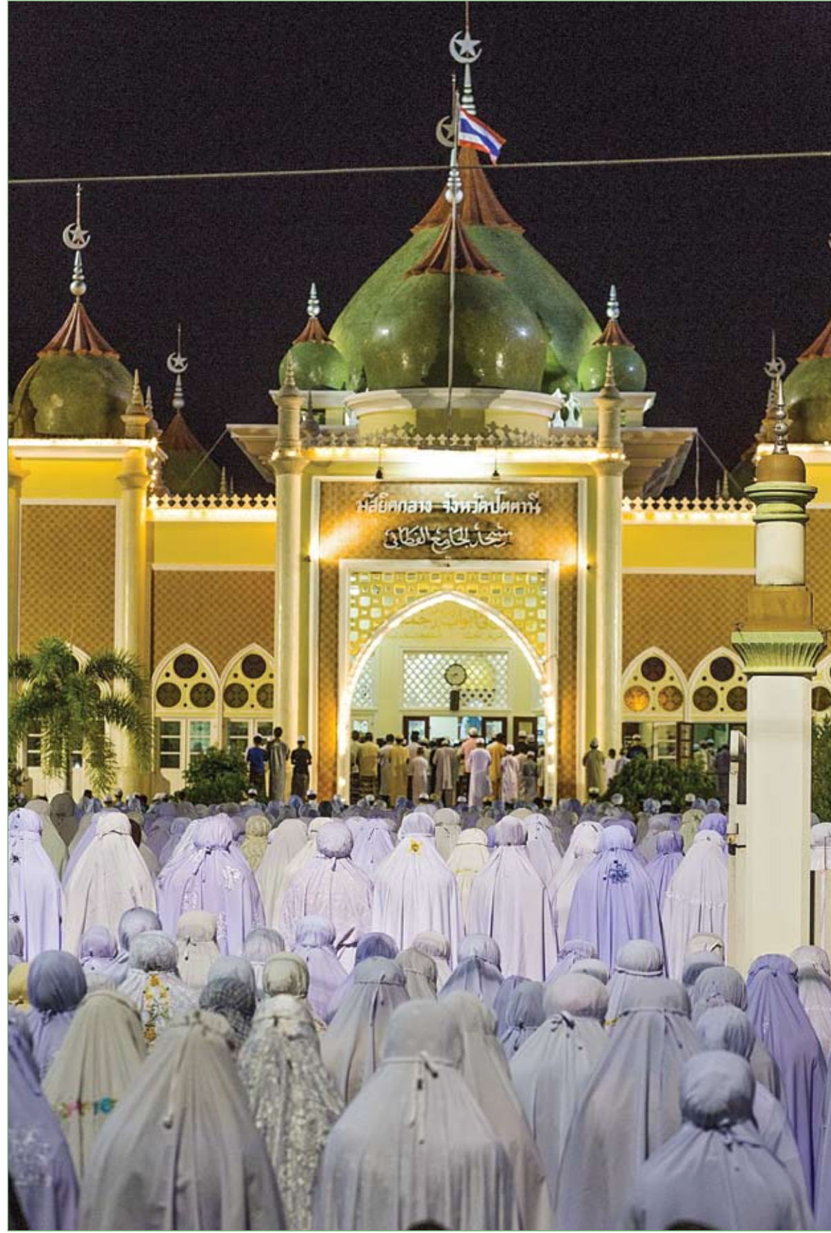
مسلمون يؤدون الصلاة خلال شهر رمضان في مسجد الجامع الفضائي في محافظة باتاني الجنوبية في تايلاند.