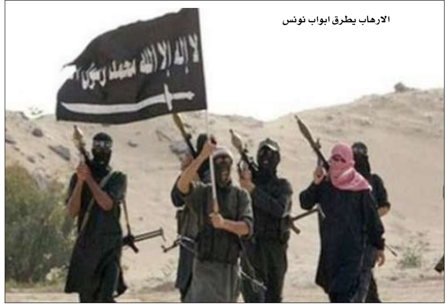
الارهاب يطرق ابواب تونس

هجوم كتيبة الموقعون بالدماء بالتنسيق مع جماعة التوحيد والجهاد، يتحركون رفقة عدد من المسلحين من جنسيات مختلفة، على مستوى شمال مالي وجنوب ليبيا بالقرب من الحدود الجنوبية لتونس، وذلك بهدف تنفيذ هجمات إرهابية ضد أهداف فرنسية وأمريكية، ردا على العمليات العسكرية الفرنسية في شمال مالي. وأوضحته نفس المصادر أن مصالح الأمن الجزائرية على درجة من اليقظة على مستوى الحدود مع مالي وليبيا وتونس لمنع أي محاولة تسلل إلى داخل التراب الجزائري كما وجهت تحذيرات إلى نظيرتها في تونس وليبيا لتشديد المراقبة على الحدود وأخذ الحيطة.