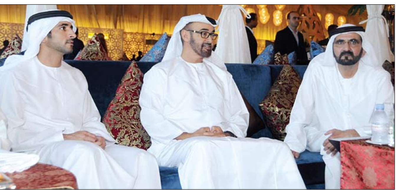
محمد بن راشد يتبادل التهاني مع محمد بن زايد بحلول شهر رمضان المبارك

• دبي-وام: التقى صاحب السمو الشيخ محمد بن راشد آل مكتوم نائب رئيس الدولة رئيس مجلس الوزراء حاكم دبي رعااه الله مساء امس اخاه الفريق أول سمو الشيخ محمد بن زايد آل نهيان ولي عهد أبوظبي نائب القائد الأعلى للقوات المسلحة وذلك بحضور سمو الشيخ حمدان بن محمد بن راشد آل مكتوم ولي عهد دبي وسمو الشيخ مكتوم بن محمد بن راشد آل مكتوم نائب حاكم دبي. وقد تبادل صاحب السمو الشيخ محمد بن راشد آل مكتوم والفريق أول سمو الشيخ محمد بن زايد آل نهيان التهنية بشهر رمضان المبارك راجيانا الله سبحانه وتعالى ان يعيد الشهر الفضيل على قيادتنا وشعبنا ودولتنا الحبيبة بالخير واليمن ودوام التواصل والعطاء في شهر البركة والعطاء. (التفاصيل ص2)