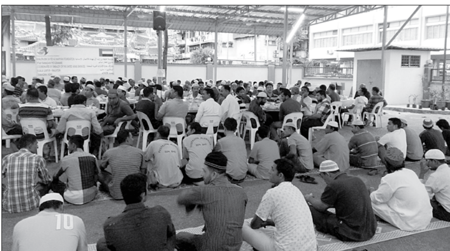
عدد من المساجد ودور الأيتام والجامعات من بينها الجامعة الإسلامية العالمية وجامعة كوالالمبور وجامعة ملتيبيدا وسيستمر هذا البرنامج على مدى أيام شهر رمضان المبارك.

والدراسات الإسلامية في المدارس والمراكز والمؤسسات التعليمية التي تشرف عليها الإدارة الدينية بولاية بهانغ. من جانبها تقدمت الإدارة العليا للجامعة الإسلامية العالمية في ماليزيا بأسمى آيات التقدير والعرفان لصاحب السمو الشيخ خليفة بن زايد آل نهيان رئيس مجلس أمناء مؤسسة خليفة بن زايد آل نهيان للشكر والتقدير على هذه المبادرة الكريمة. وقال سعادة الدكتور عبد العزيز برغوث نائب مدير الجامعة الإسلامية